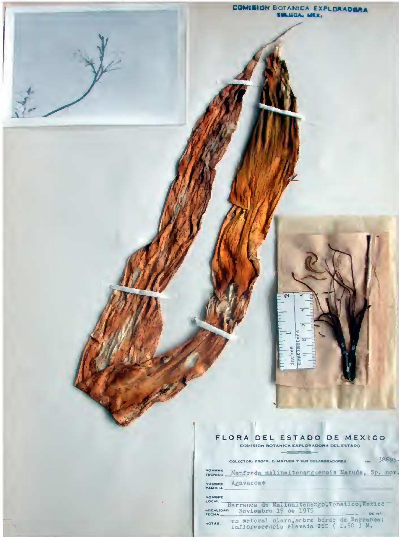
Fig. 2. Manfreda malinaltenangensis Matuda. Tipo: México. Estado de México, (municipio de Ixtapan de la Sal), barranca de Malinaltenango, 15 noviembre 1975, E. Matuda 38695 (lectotipo: CODAGEM).